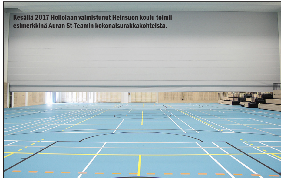
Kesällä 2017 Hollolaan valmistunut Heinsuon koulu toimii esimerkkinä Auran ST-Teamin kokonaisurakkakohteista.